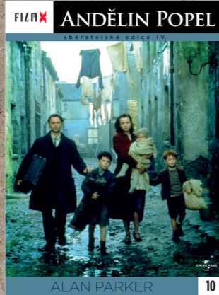
10 - Andělin popel