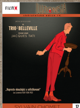
12 - Iluzionista

FILM X - sběratelská edice IV - navazuje na předchozí úspěšné řady vydávané ve spolupráci týdeníku Reflex a Hollywood Classic Entertainment. Každý měsíc Vám ve vybraných prodejnách denního tisku nabídneme snímky, které si již získaly trvalou přízeň diváků.