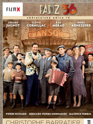
11 - Paříž 36