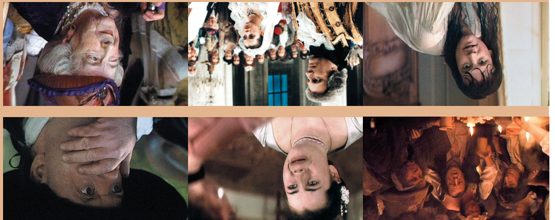
Oscar® je registrovaná ochranná známka Akademie filmového umění a věd.