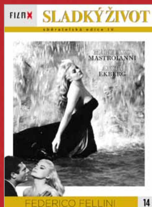
14 - Sladký život