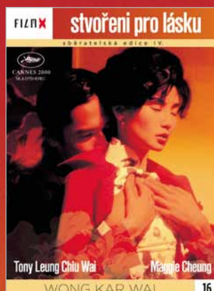
16 - Stvoření pro lásku