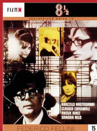
15 - 8 1/2