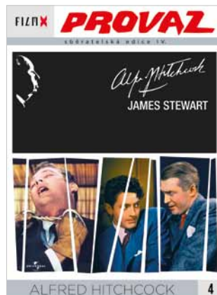
4 - Pro vaz

FILM X - sběratelská edice IV - navazuje na předchozí úspěšné řady vydávané ve spolupráci týdeníku Reflex a Hollywood Classic Entertainment. Každý měsíc Vám ve vybraných prodejnách denního tisku nabídneme snímky, které si již získaly trvalou přízeň diváků.