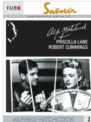
2 - Sabotér