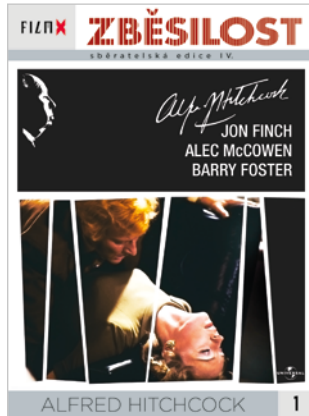
1 - Zběsilost