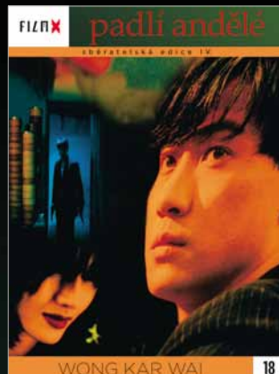
18 - Padlí andělé