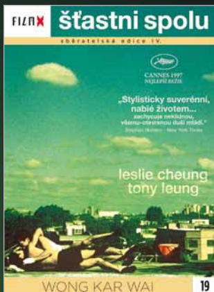
19 - Šťastni spolu