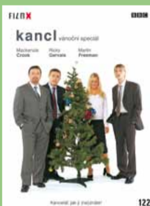
122 - Kancel vánoční speciál