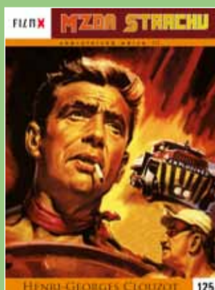
125 - Mzda strachu