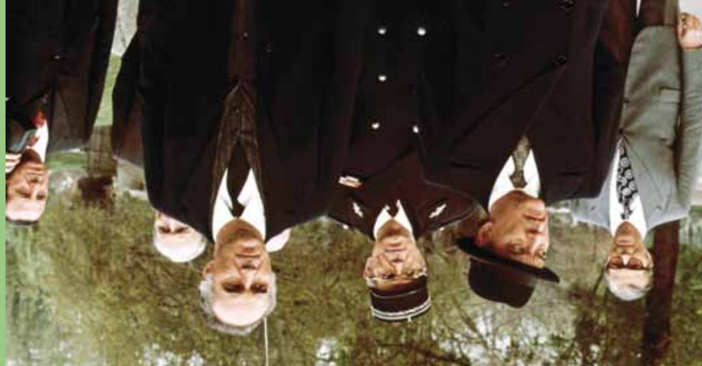
Oscar® je registrovaná ochranná známka Akademie filmového umění a věd.

OCEŇENÍ FILMU 1975 SDRUŽENÍ FILMOVÝCH ŽURNALISTŮ, FF CANNES, ZLATÁ PALMA 1961 VIRIDIANA 1967 FF BENÁTKY, ZLATÝ LEV KRÁSKA DNE - Luis Buñuel