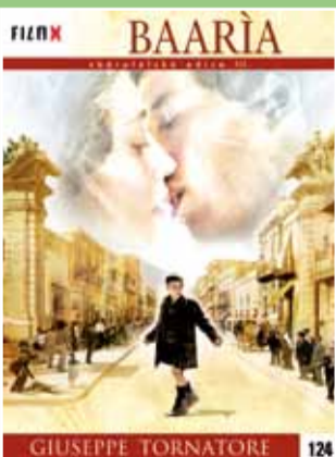
124 - Baaria