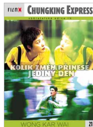
21 - Chungking express

FILM X - sběratelská edice IV - navazuje na předchozí úspěšné řady vydávané ve spolupráci týdeníku Reflex a Hollywood Classic Entertainment. Každý týden Vám ve vybraných prodejnách denního tisku nabídneme snímky, které si již získaly trvalou přízeň diváků.