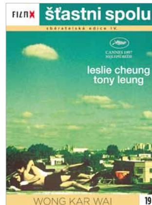
19 - Šťastni spolu