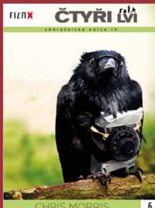
6 - Čtyři lvi

FILM X - sběratelská edice IV - navazuje na předchozí úspěšné řady vydávané ve spolupráci týdeníku Reflex a Hollywood Classic Entertainment. Každý měsíc Vám ve vybraných prodejnách denního tisku nabídneme snímky, které si již získaly trvalou přízeň diváků.