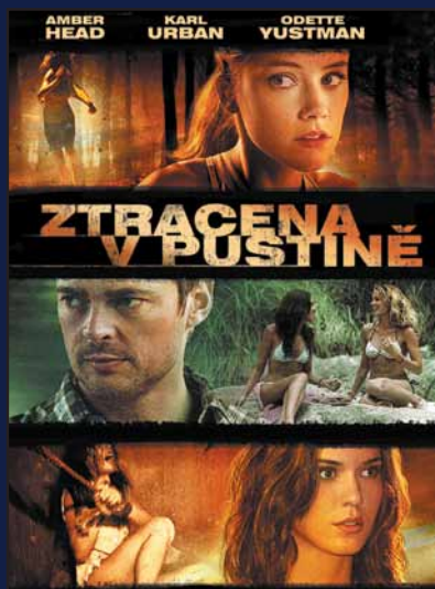
ZTRACENA V PUSTINĚ