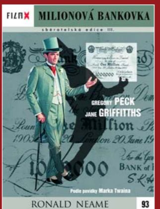
93 – Milionová bankovka