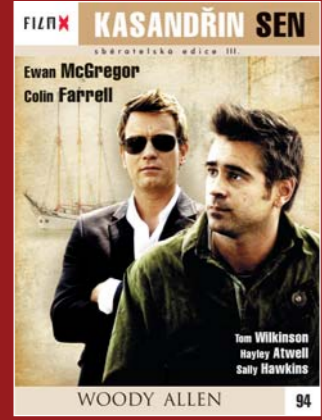
94 – Kasandrín sen