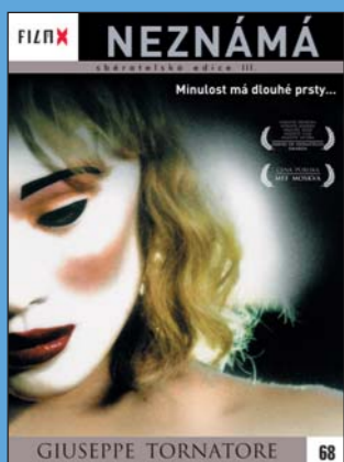
68 – Neznámá