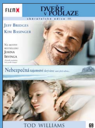
69 – Dveře v podlaze

FILM X – sbĚratelská edice III – navazuje na předchozí úspěšné řady vydávané ve spolupráci týdeníku Reflex a Hollywood Classic Entertainment. Každý měsíc Vám ve vybraných prodejnách denního tisku nabídneme snímky, které si již získaly trvalou přízeň diváků.