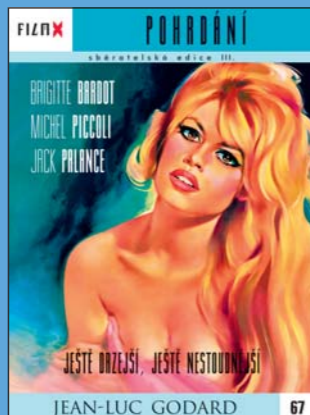
67 – Pohrdání