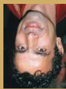
Tarsem Singh (nar. 26. 5. 1961, Indie)

Indický režisér, který po absolvování střední školy odešel do USA, kde zakotvil u studia filmu. Začal matematickým videoklipů a v této oblasti ho proslavil především klip k písni Losing My Religion od R. E. M. Dále se věnoval reklamám, za něž obdržel i několik ocenění na různých filmových festivalech, a některé se dokonce staly součástí sbírky Muzea moderního umění. Na plátně debutoval filmem CELA (2000). Přiběh polistický pětácti po úkrytu svého setového vraha fascinoval diváky svou jedinečnou vizuální stránkou a pestrostí. Film byl nominován i na Oscara® za nejlepší film. Následoval zatím poslední Singhův snímek PÁD (2006) se stejné originálním výpravým ztvárněním, které potvrdilo Singhovu výjimečnost na poli filmového obrazu.