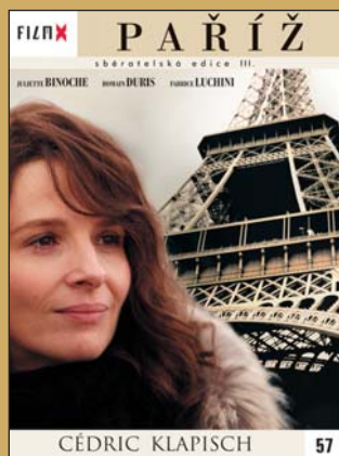
57 – Paříž