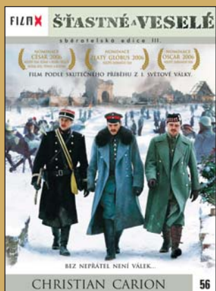
56 – Šťastné a veselé