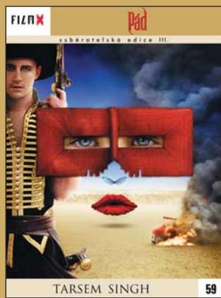
59 – Pád

FILM X – sběratelská edice III – navazuje na předchozí úspěšné řady vydávané ve spolupráci týdeníku Reflex a Hollywood Classic Entertainment. Každý měsíc Vám ve vybraných prodejnách denního tisku nabídneme snímky, které si již získaly trvalou přízeň diváků.