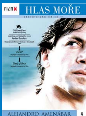
4 – Hlas moře