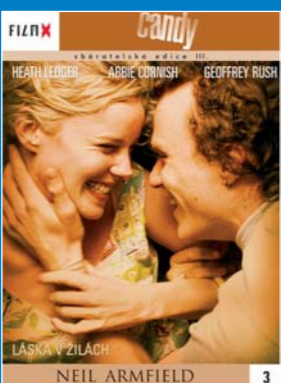
3 – Candy