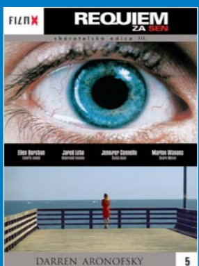
5 – Requiem za sen