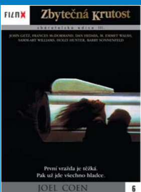
6 – Zbytečná krutost