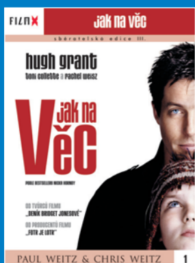
1 – Jak na věc