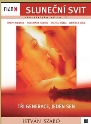
88 – Sluneční svit