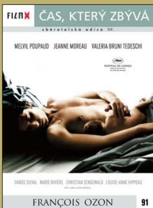
91 – Čas, který zůstává

FILM X – sběratelská edice III – navazuje na předchozí úspěšné řady vydávané ve spolupráci týdeníku Reflex a Hollywood Classic Entertainment. Každý měsíc Vám ve vybraných prodejnách denního tisku nabídneme snímky, které si již získaly trvalou přízeň diváků.