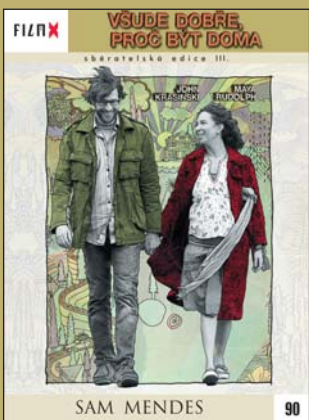
90 – Všude dobře, proč být doma