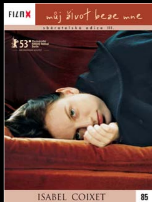
85 - Můj život beze mne