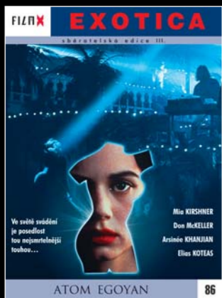
86 - Exotica