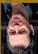
Steve Buscemi (nar. 13. 12. 1957, Brooklyn, USA)