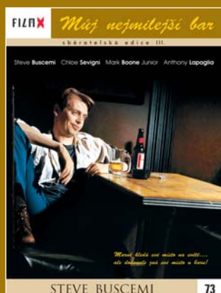
73 – Můj nejmilejší bar

FILM X – sběratelská edice III – navazuje na předchozí úspěšné řady vydávané ve spolupráci týdeníku Reflex a Hollywood Classic Entertainment. Každý měsíc Vám ve vybraných prodejnách denního tisku nabídneme snímky, které si již získaly trvalou přízeň diváků.