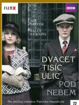
72 – Dvacet tisíc ulic pod nebem