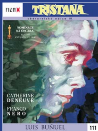
111 – Tristana