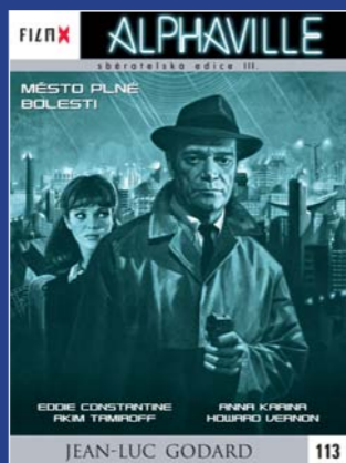
113 – Alphaville