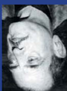
Luis Buñuel (nar. 22. 2. 1900, Calanda, Španělsko zem. 29. 7. 1983, Mexico City, Mexiko)

NEJLEPŠÍ CIZOJAZYČNÝ FILM NOMINACE NA OSCARA® PŘEDMĚT TOUHY (1977), které oba získaly nominaci na Oscara® za nejlepší scénář. festivalech, nebo TRISTANA (1970), nominovanou na Oscara®. Velké úspěchy pak představovaly filmem VIRIDIANA (1961), který tam byl dokonce zakázán kvůli rouhavému charakteru. Z řady Robinsona Crusoe a NA VĚTRNÉ HURČE. Velký rozruch v rodném Španělsku způsobil Buñuel si vyzkoušel také adaptace literární klasiky – v roce 1954 natočil komedie FLAMENDR (1949), dramata ZAPOMENUTÍ (1950) a SUSANA (1951). S Dalím spolupracoval také na dalším snímku ZLATÝ VĚK (1930). Následovala krátkometrážní úspěšně nerealizovaná hračka, ANDALUSKÝ PES (1929). skandalizoval a šokující. Spolu se Salvadorém Dalím vytvořil svůj první film, Slavný přírůpek surrealistických snímků, jehož díla byla ve své době známa