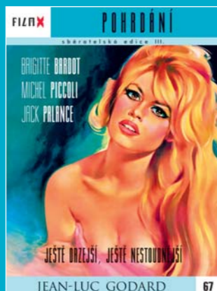
67 - Pohrdání