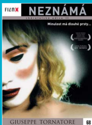
68 - Neznámá