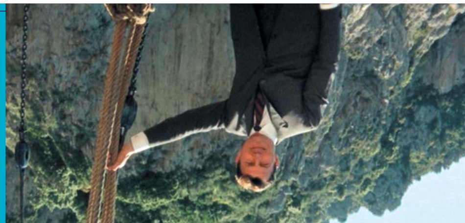
2004 - CENA FIRESCAL, MFF SAN SEBASTIAN NOTRE MUSIQUE FILM ROKU